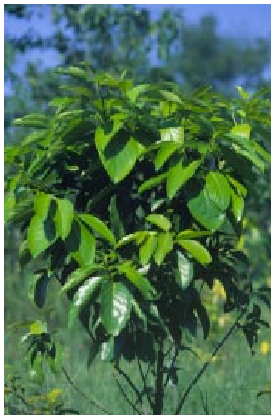
大果厚殼桂。