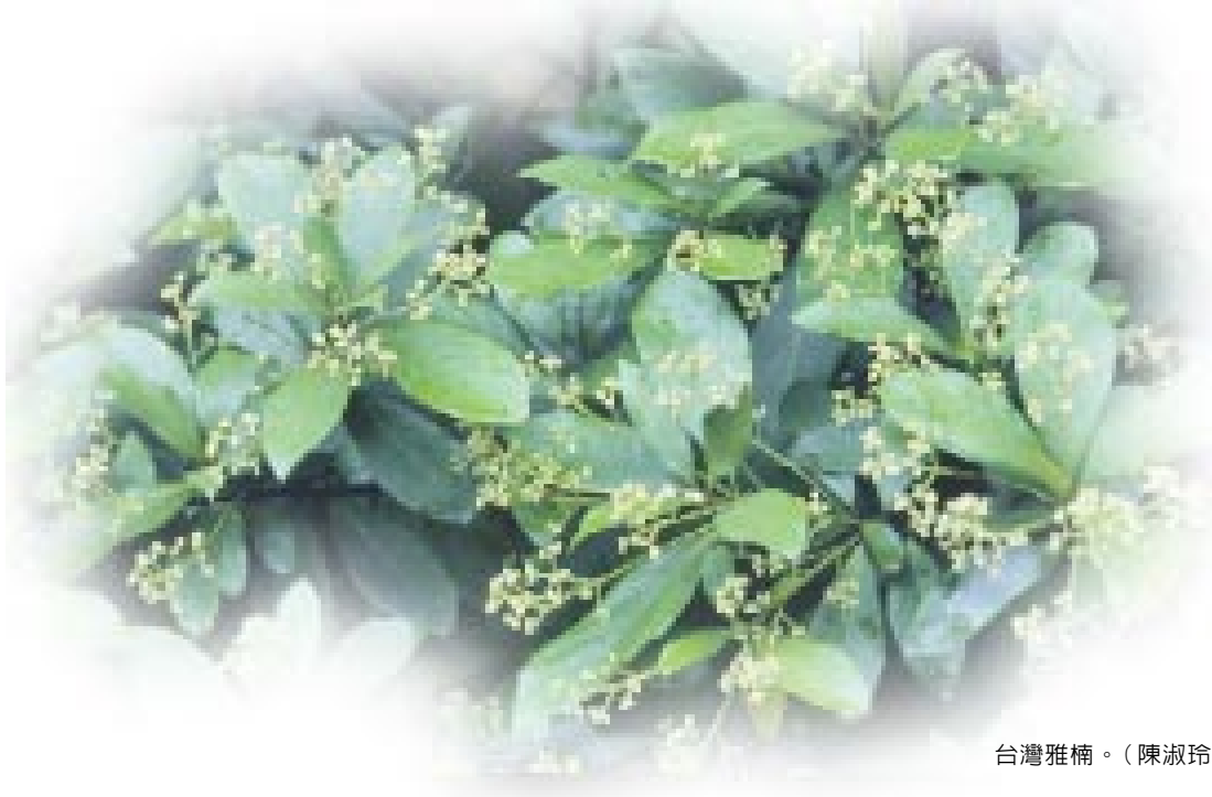
台灣雅楠。

(Blume) Koidz. var. aurata (Hayata) Hatusima)